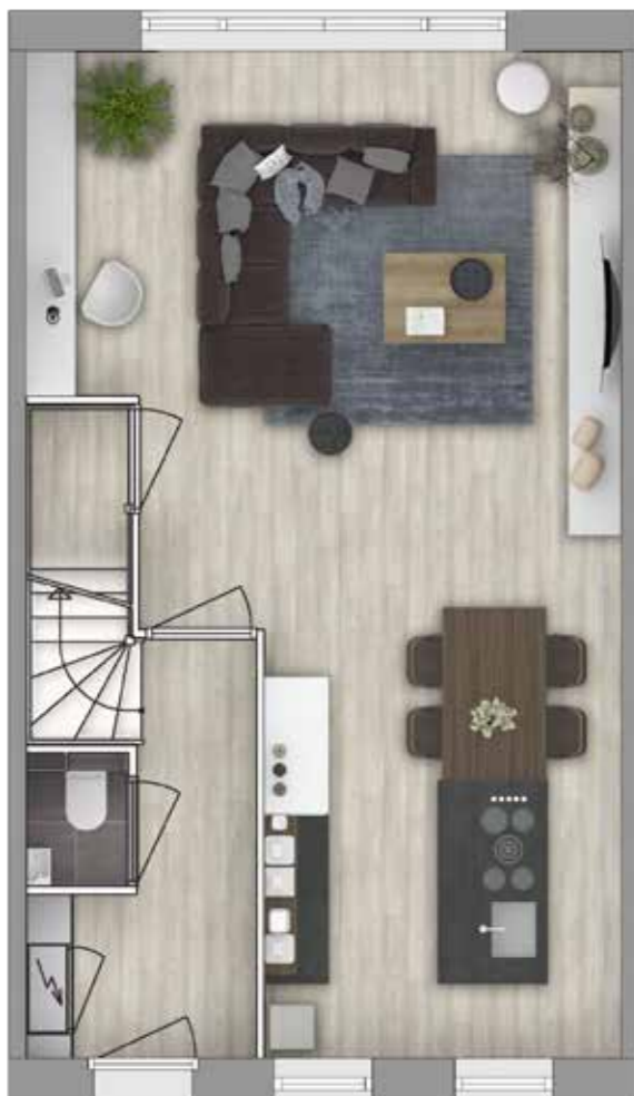
Plattegrond A Stijl stedelijk Geveltype 2 Begane grond

Liever een andere indeling? Check de woonconfigurator op www.carteblanchepionierkwartier.nl en ontdek alle mogelijkheden.