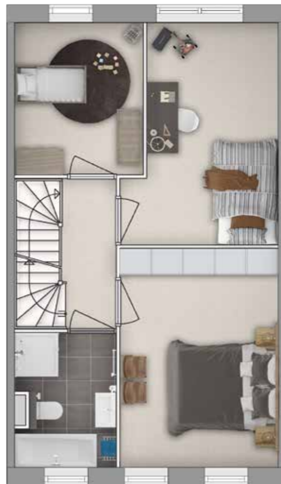
Plattegrond A Stijl stedelijk Geveltype 2 Eerste verdieping