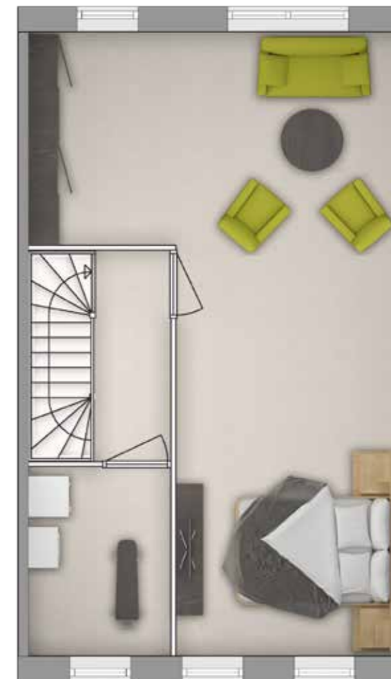
Plattegrond A Stijl stedelijk Geveltype 2 Tweede verdieping